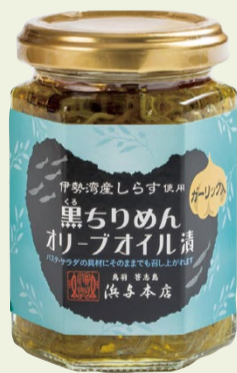
黒ちりめんオリーブオイル漬