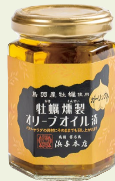
牡蠣燻製オリーブオイル漬(ガーリック)