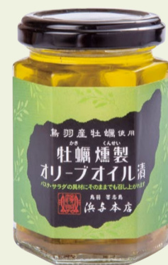
牡蠣燻製オリーブオイル漬